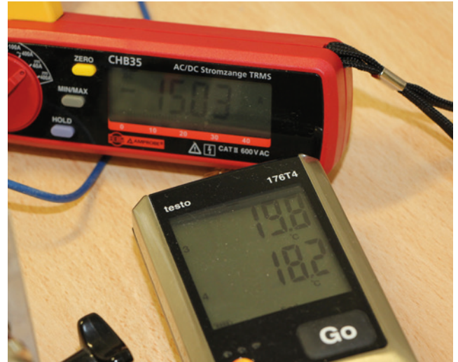
Abb. 2 Messwerte während der Prüfung Fig. 2 Measured values during a test

In addition to HF attenuation, another important criterion for any EMC cable gland is its current-carrying capacity – the ability of a component to conduct a specific continuous current. In the event of malfunctions, incorrect assembly or lightning strike, high currents can flow through the cable screen and the cable gland. The voltage drop due to the transfer resistance of a cable gland creates a loss based on the current flowing in the cable screen.