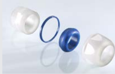
Abb. 2 Fig. 2

Polyamid Inkl. Unterlegscheiben Metrisches Gewinde EN 60423 Schutzart IP 68 bis 15 bar, IP 69K