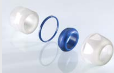
Abb. 2 Fig. 2

Polyamid Inkl. Unterlegscheiben Metrisches Gewinde EN 60423 Schutzart IP 68 bis 15 bar, IP 69K