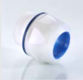
Abb. 1 Fig. 1