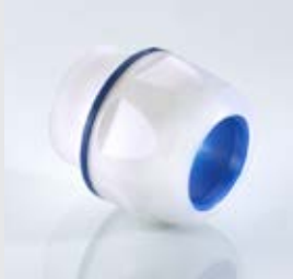
Abb. 1 Fig. 1